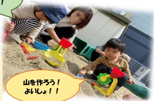
山を作ろう！ よいしょ！！

晴れた日の活動では、園庭でめいっ ぱい体を動かしたくさん遊びました。 砂場が大人気！また遊びましょう！