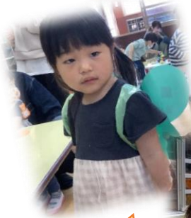
ちょうちょうに 変身したよ！

トマト・きゅうりの苗を植えました。 「おおきくな～れ！」とおまじない をかけて、何度も水やりをする姿 はとても微笑ましいものでした！！