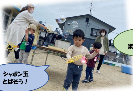
シャボン玉 とぼそう！